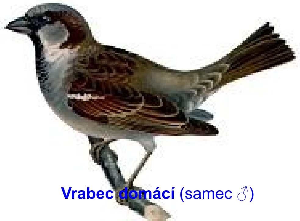
Vrabec domácí (samec ♂)