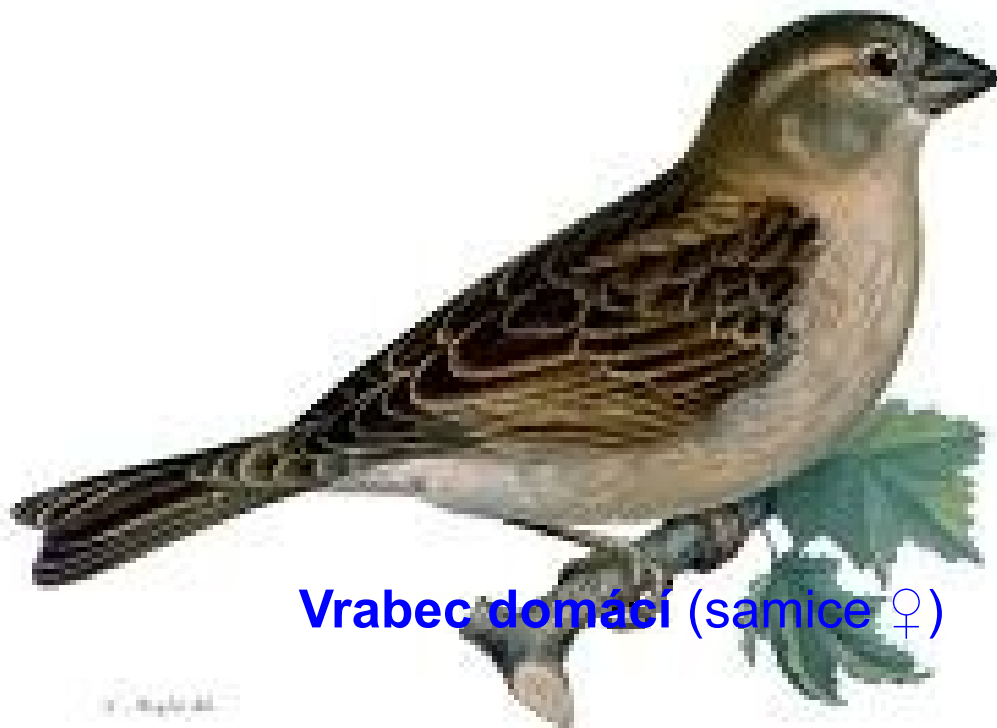
Vrabec domácí (samice ♀)