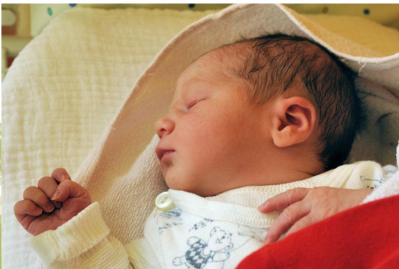
Novorozenec a batole