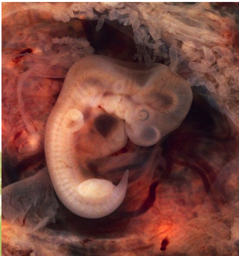
Lidský plod 5 týdnů po oplození

Lidský zárodek roste, mění se v plod a jeho tělesné proporce jsou čím dál víc podobné lidským. Porod je náročný proces pro matku i dítě, probíhá pod dohledem lékařů.